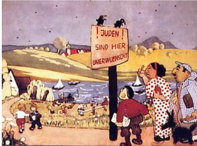
A /4 "Les Juifs sont ici indésirables", caricature antisémite, Allemagne nazie, 1938.