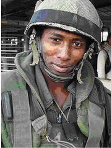
SOLDAT DE TSAHAL A NAPLOUSE EN 2006.