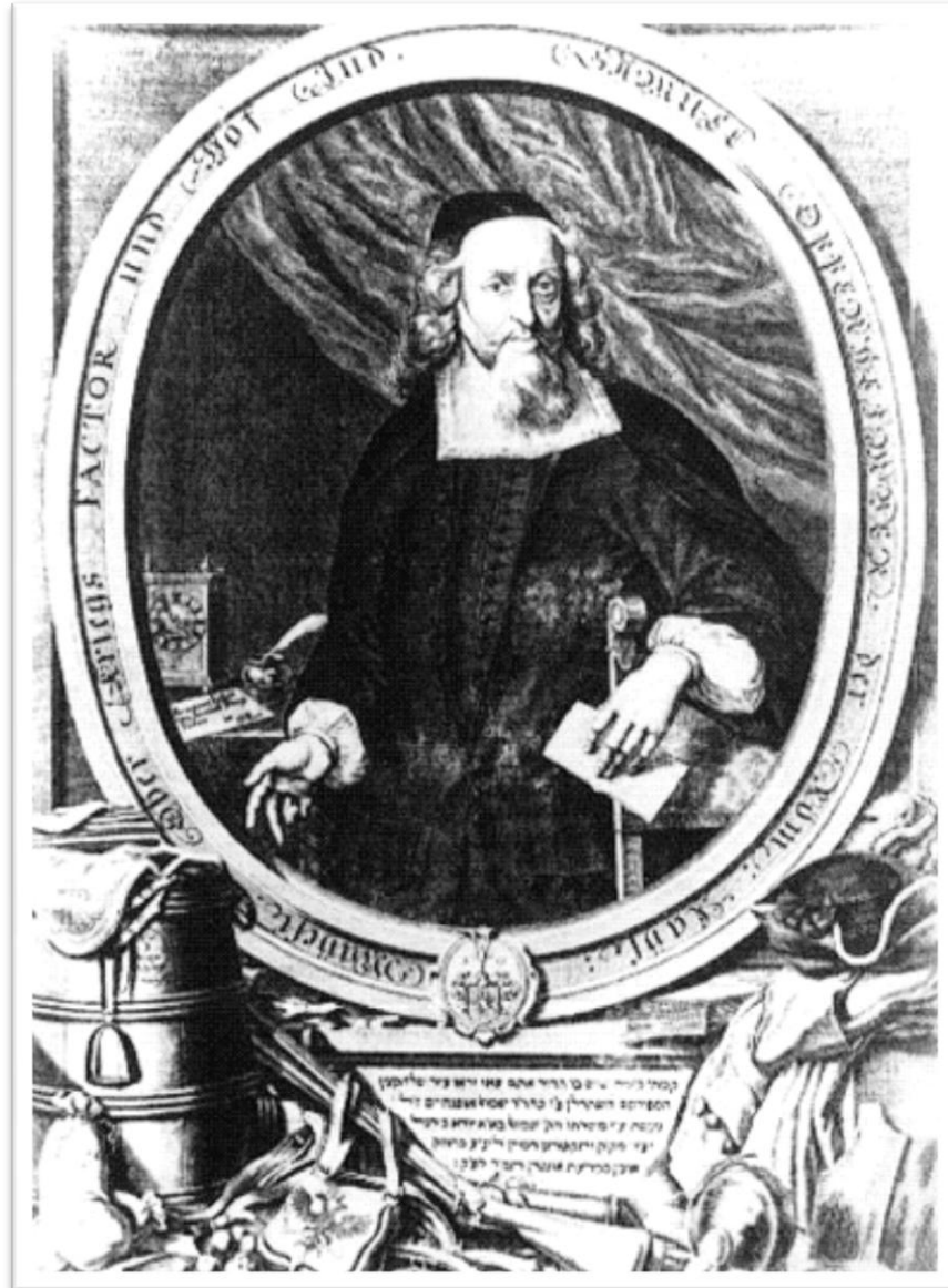
2. Portrait de Samuel Oppenheimer (1635-1703), "Juf de cour" de l'empereur à Vienne, conservé au Musée du judaïsme de Francfort.